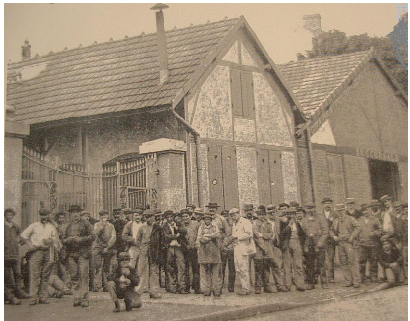
Le personnel attend devant l'entrée